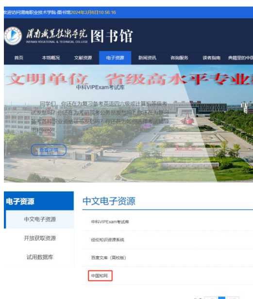
渭职图书馆门户网